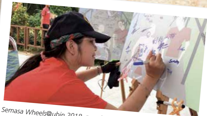
Semasa Wheels@ubin 2018, ramai peserta menandatangani poster menunjukkan sokongan mereka bagi Accessible Ubin dan masa depan pulau itu.

Untuk maklumat lanjut mengenai Pulau Ubin, kunjungi www.ubin.sg atau hubungi kami di nparks_pulau_ubin@nparks.gov.sg