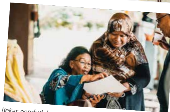
Bekas penduduk membawa foto lama dari zaman kanak-kanak mereka untuk mengingati pengalaman indah membesar di Pulau Ubin.