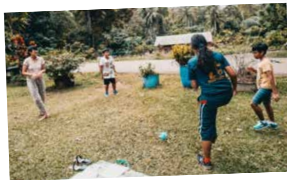
Orang ramai juga turut berseronok dengan bermain beberapa permainan tradisional!

Syazwan Majid Penulis, Wan's Ubin Journal ( http://wansubinjournal.blogspot.com )